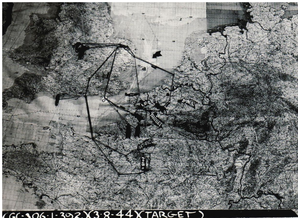
Route 3 augustus 1944