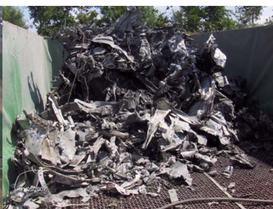
bergingsteam van de Koninklijke luchtmacht onder leiding van Kapitein Petersen.

Inmiddels is de berging afgerond. Op de site zal binnenkort meer te vinden zijn over deze Thunderbolt. De stichting hoopt op termijn een aantal onderdelen van dit vliegtuig te mogen ontvangen voor in het museum.